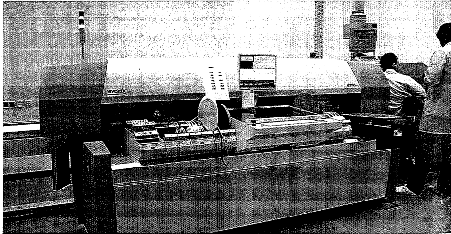
Neue Fertigungslinie beim Komponentenbauer Hund: Wettbewerbsvorteile durch Flexibilität und Geschwindigkeit

Bislang ist Hund eher auf kleine bis mittlere Seriengrößen fokussiert. „Die Investition spiegelt unsere wirtschaftliche Zuversicht wider“, sagt Vertriebsleiter Burkhard Wetz. Durch die kurzen Rüstzeiten der neuen Anlage kann Hund jetzt noch flexibler auf Produktionsänderungen reagieren. Bis zu 34.000 gegurtete Halbleiterbauteile aller Art lassen sich mit hoher Prozesssicherheit pro Stunde verarbeiten.